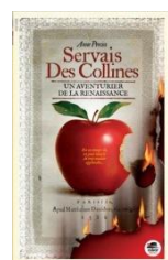
Servais Des Collines d'Anne Percin