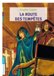
La route des tempêtes de Brigitte Coppin