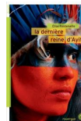
La dernière reine d'Ayiti d'Elise Fontenaille