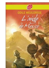
L'aigle de Mexico d'Odile Weulersse