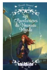
Les aventurières du Nouveau Monde : une terre de promesse de Gwenaële Barussaud