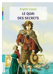
Le quai des secrets de Brigitte Coppin