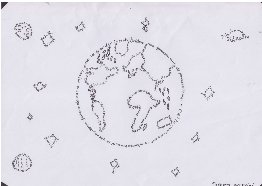
Sara, classe 6P des Buttes, C. Guignard Potterat

poème dont les phrases sont disposées de façon à former un dessin, sujet du poème